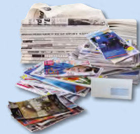
Tous les papiers se recyclent ! Journaux, magazines, publicités, prospectus, enveloppes, catalogues, annuaires, courriers, lettres, livres, cahiers

de bacs, de sacs ou de colonnes pour trier les :