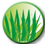
Les déchets de tonte