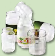
Pots et bocaux

Le verre de vitre et de vaisselle n'a pas la même composition que le verre alimentaire. Il doit être déposé dans le bac d'ordures ménagères.