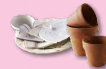
Vaisselle cassée, terre cuite, porcelaine

Des calendriers de collecte par commune sont à votre disposition sur simple demande au 0 800 00 60 40.