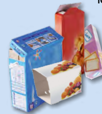
Emballages en carton