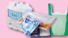
Films et sacs en plastique