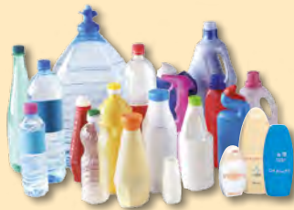
Bouteilles et flacons plastiques avec les bouchons

de bacs, de sacs ou de colonnes pour trier les :