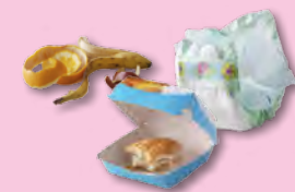
Épluchures, déchets gras ou sales

de bacs, de sacs poubelles ou de colonnes pour jeter les :