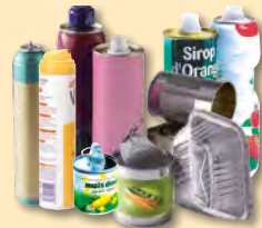
Boîtes, bidons et aérosols métalliques